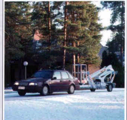
DINO 105T ist leicht und sicher zu ziehen.