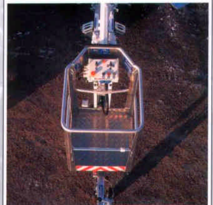
Im Aluminiumkorb der Bühne ist die zweite Bedienmöglichkeit (aller Bewegungen) mit zwei Geschwindigkeitsstufen.